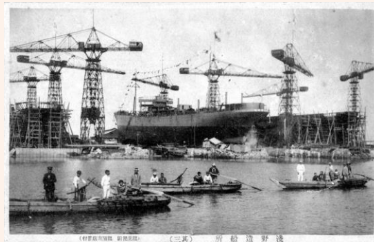
(左) 鶴見造船所 (右) 河船造野港