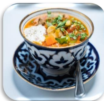
〈Mastava(マスタヴァ)ライススープ〉