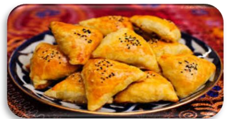
〈Samsa(サムサ)ミートパイ〉